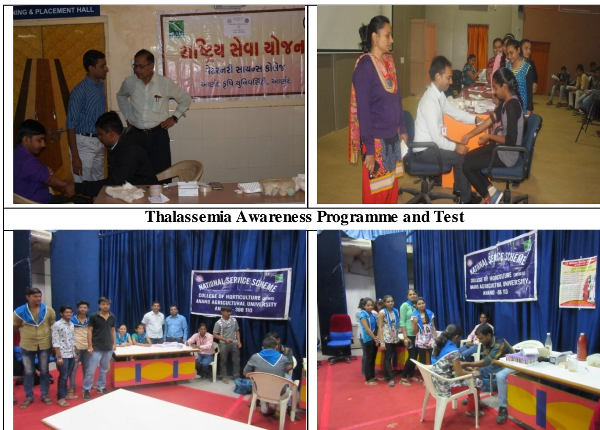
Thalassemia Awareness Programme and Test

All colleges of Anand Agricultural University were organized Thalassemia Screening test. An Awareness programme on Thalassemia was successfully organized by National Service scheme, College of Horticulture and B.A.College of Agriculture, AAU, Anand in collaboration with Indian Red Cross Society, Ahmedabad on November 10, 2016. In this programme short movie on Thalassemia was displayed by Red Cross Society.