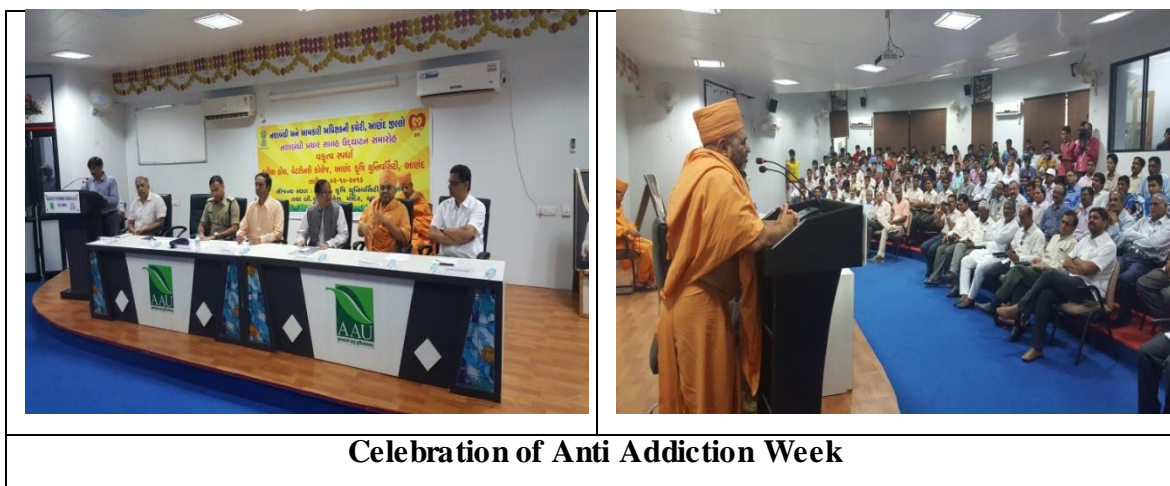
Celebration of Anti Addiction Week