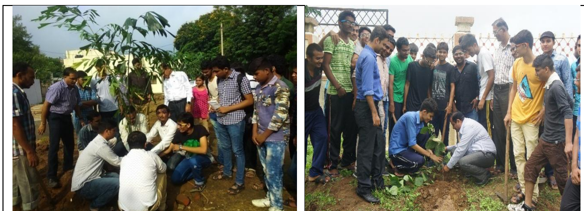
Tree Plantation Programme

Tree plantation programme were organized by different colleges of Anand Agricultural University. Around 1000 Trees were planted in various Tree Plantation Programme. A Tree plantation programme was organized at University Bhavan, AAU, Anand on August 15, 2016. University officers, Scientists, Staff members and NSS volunteers remained present during tree plantation programme. Total 40 NSS volunteers of B. A. College of Agriculture took part in this programme by planting plants of valuable tree species.