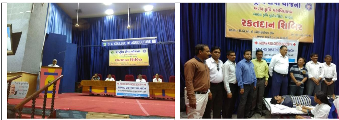
Blood donation camp