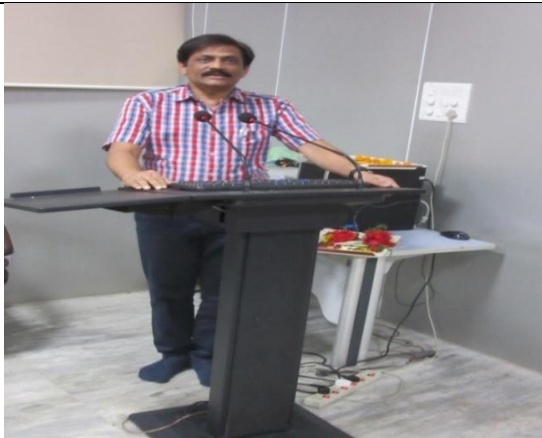
Director Students' Welfare addressing at Special Camp