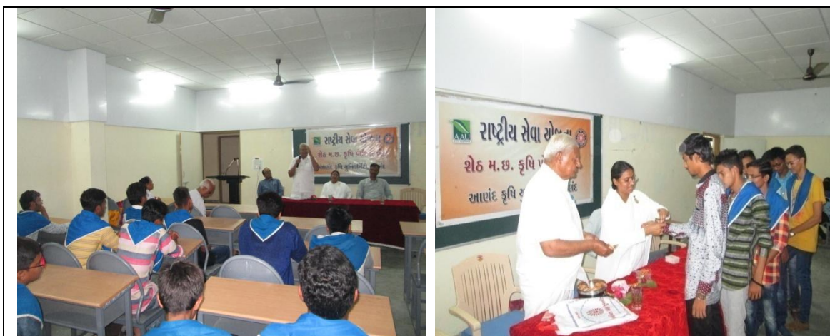
Celebration of RAKSHABANDHAN