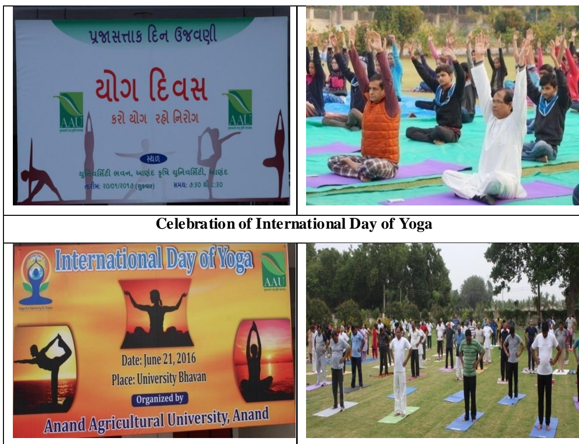
Celebration of International Day of Yoga