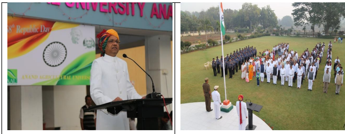
Celebration of 68 th Republic Day