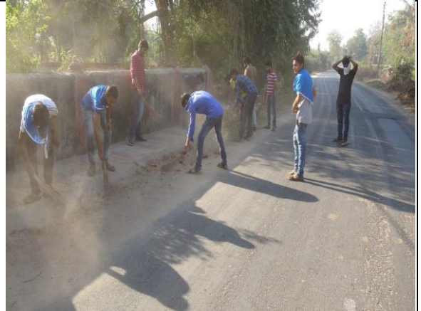
Special Camp at Koliyari village