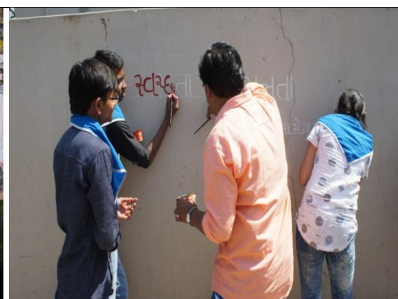
Special Camp at Tundel village