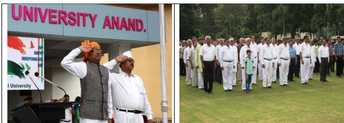
Celebration of 70 th Independence Day