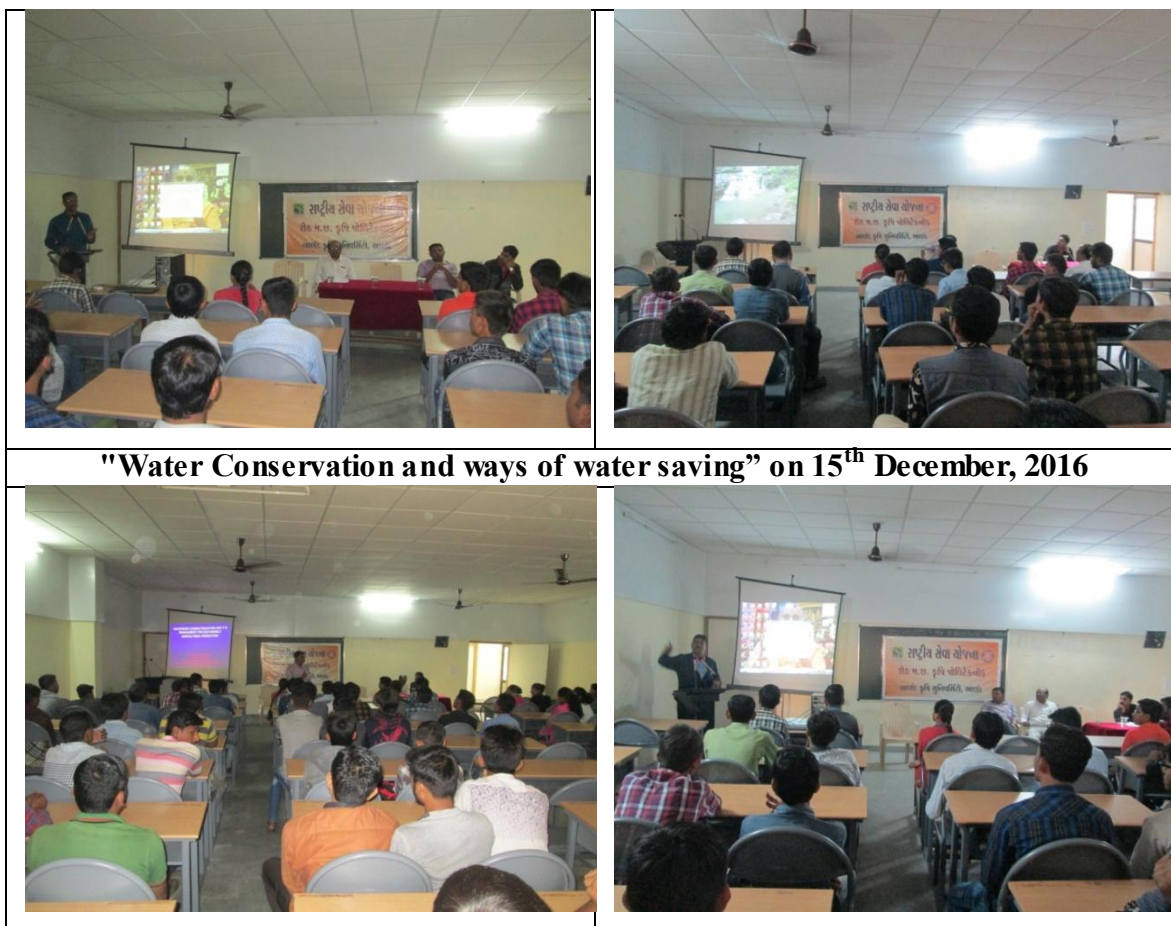
"Water Conservation and ways of water saving" on 15 th December, 2016