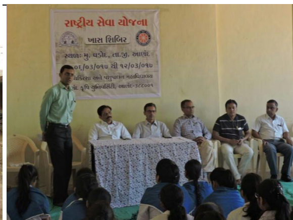
Special Camp at Vadod Village