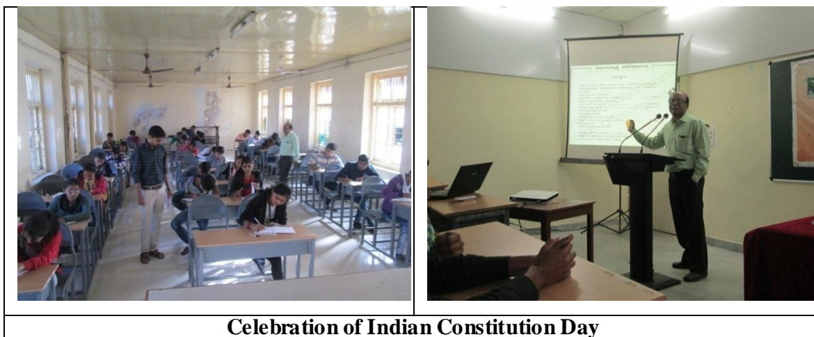
Celebration of Indian Constitution Day