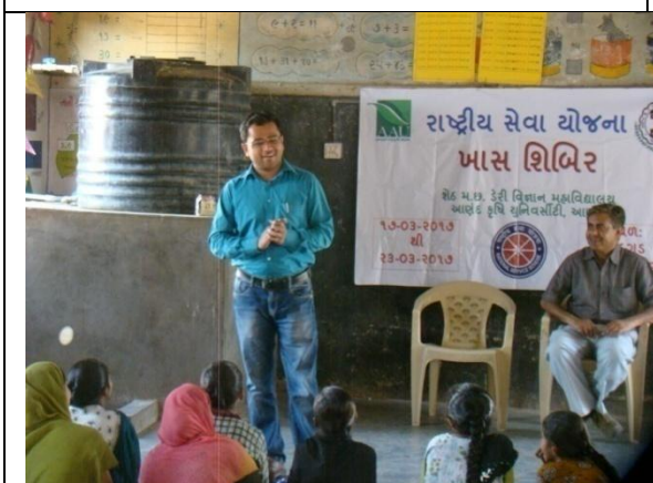
Special Camp at Hadgud village