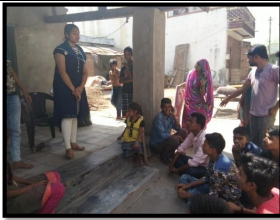
Special Camp at Sankhej village