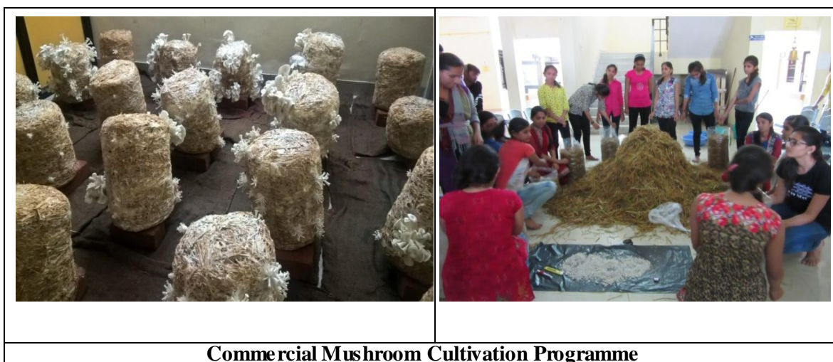
Commercial Mushroom Cultivation Programme