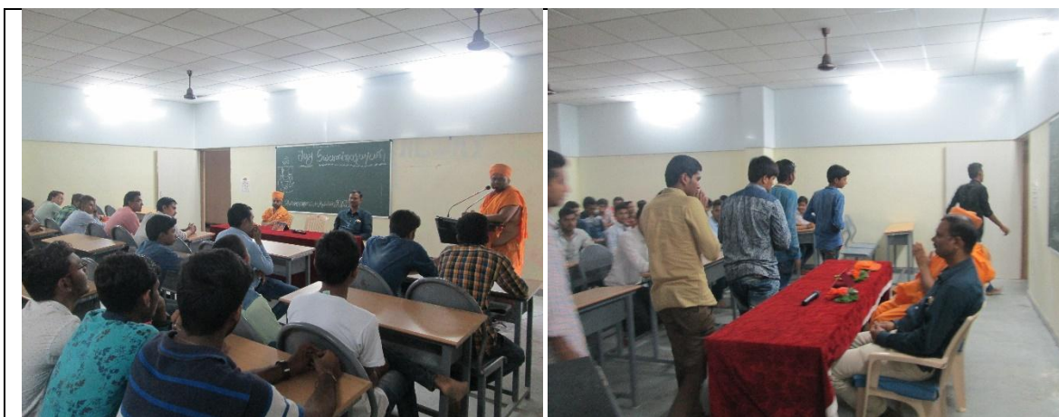
"Grow of moral values by spiritual activity programme"