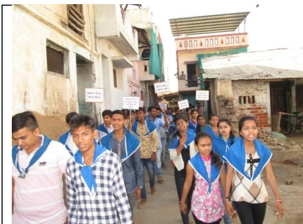
Special Camp at Piplav Village