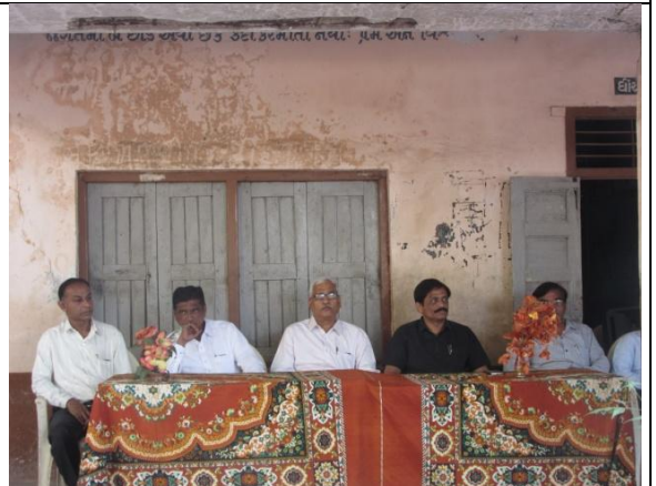
Special Camp at Asodar Village